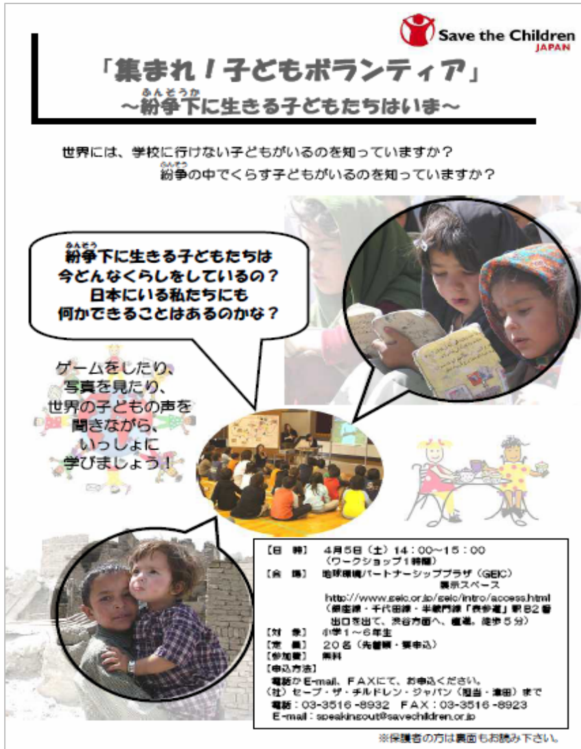
参加者募集チラシ(表)