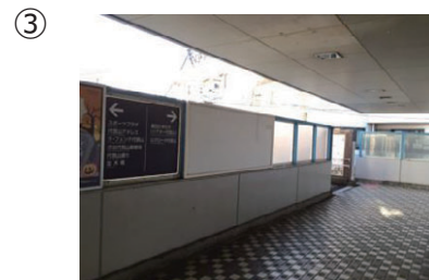
北改札を出ると、このような通路があります。改札を出てまず右に曲がり、次に、写真の奥を左に曲がります。その先も通路になっています。（④へ）