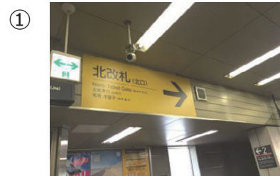
北改札（北口）の案内板を確認下さい。