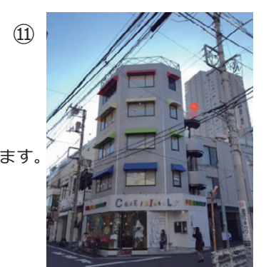
⑪ そのビルの2階にUPSTAIRS GALLERYがあります！