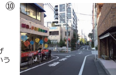
⑩ 約1分ほどで、四つ角に出ます。MR.FRIENDLY Caféの看板が左に見えます。