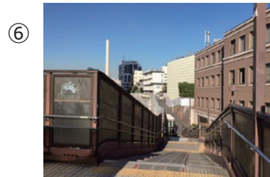
⑥ 2分ほど歩くと階段が出てきます。そこを下ります。