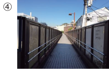
④ 通路を渋谷方向に2分ほど歩きます。（線路上になります）