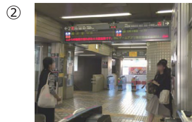
北改札（写真奥）を出ます。