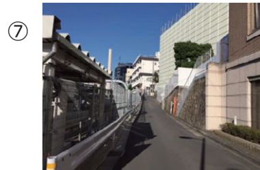
⑦ 階段を下りきると、今度は線路沿いに上り坂になっています。突き当たりまで進みます。（約1分）