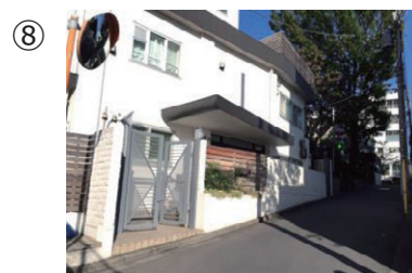
⑧ 突き当たりはこのような建物です。（STYLIO with 代官山）ここを道なりに右折して突き当たりまで進みます。（約20秒）