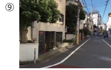
⑨ 突き当たりを左に折れると、角にFRIJIOLESというカフェがあります（写真左）この道を進みます。（渋谷方向へ）